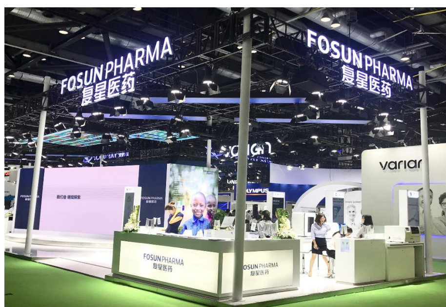
上海复星医疗 展台