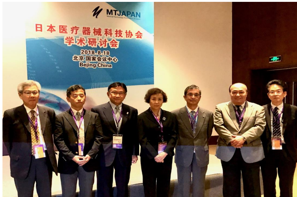
会议主席·讲师·国际委员会成员