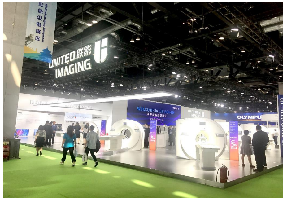
上海联影医疗科技 展台