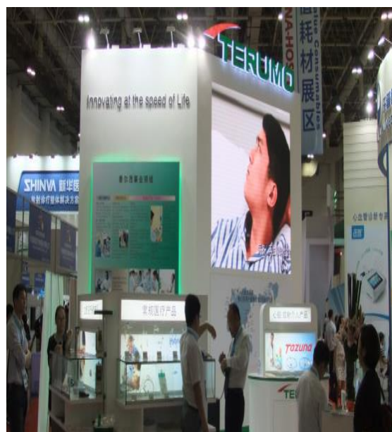
テルモ社出展ブース