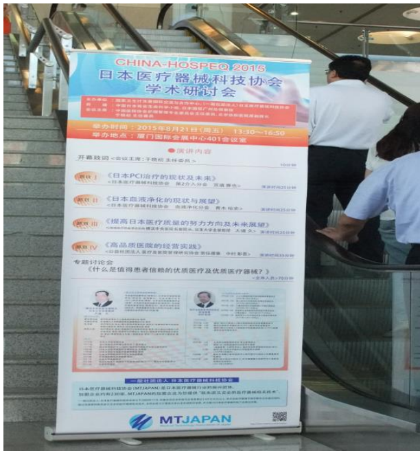
学術シンポジウム告知バナー