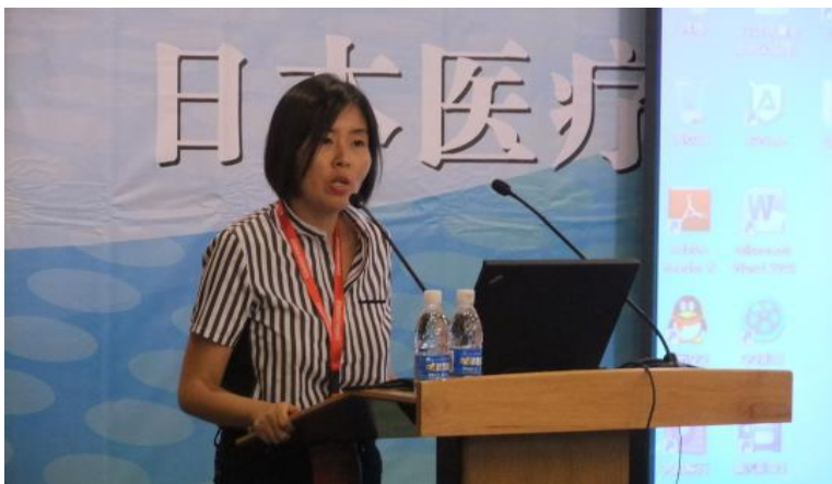
開会挨拶 衛生計生委 尹海燕副部長