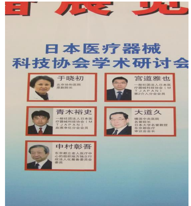
MTJAPANシンポジウム案内