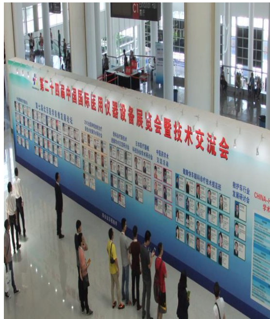
シンポジウム案内(全景)