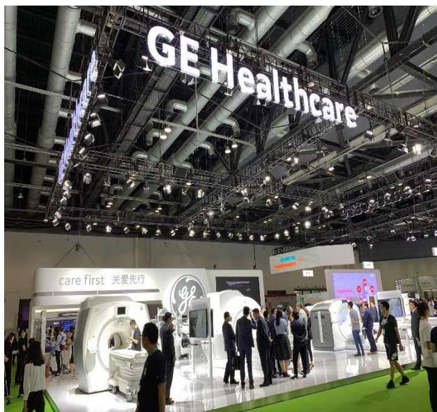
通用电气医疗系统 展台