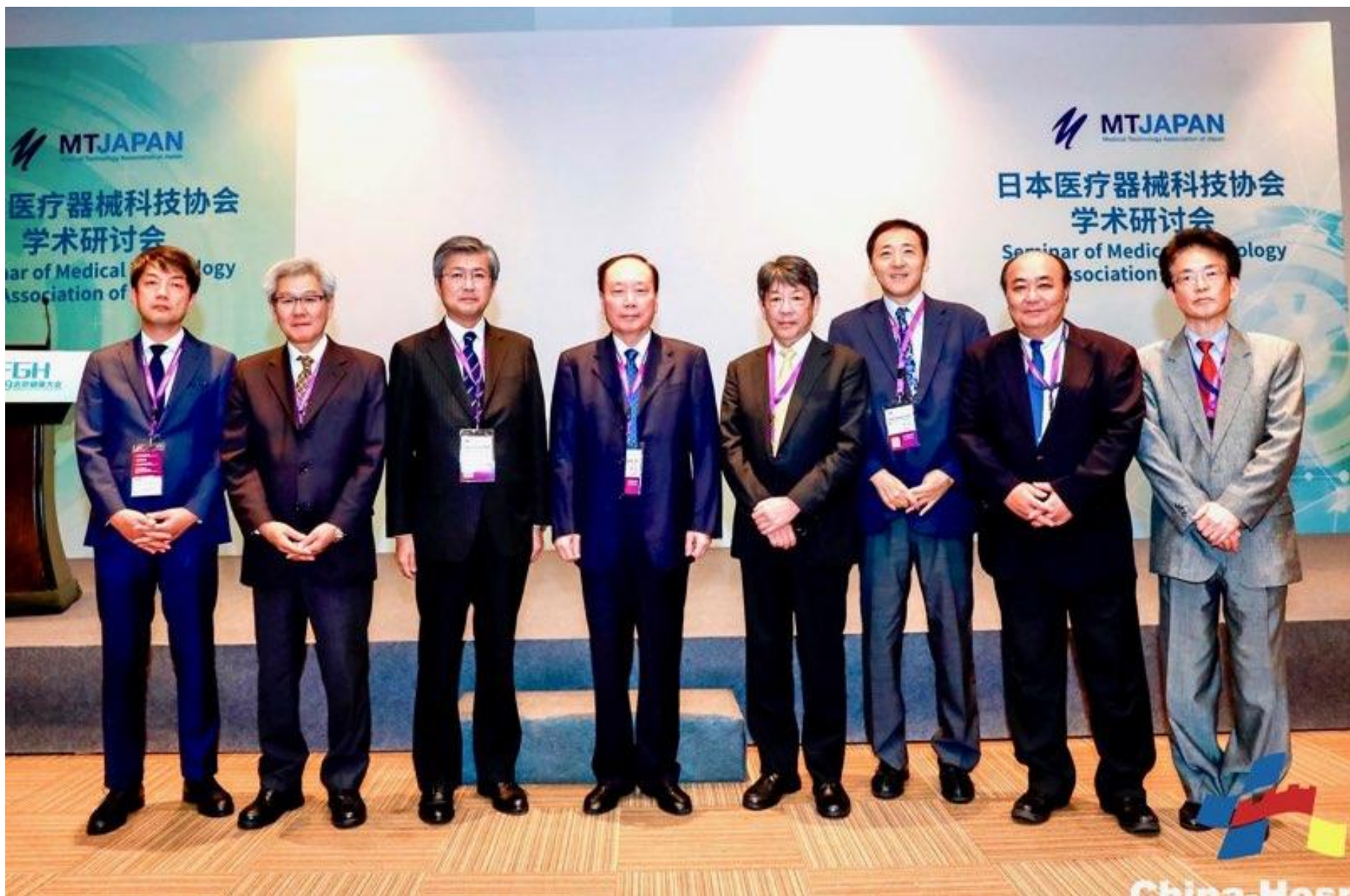
会议主席·讲师·国际委员会成员