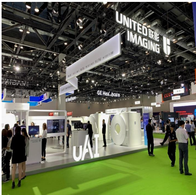
上海联影医疗科技 展台