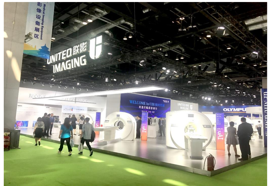
上海ユナイテッドイメージングブース