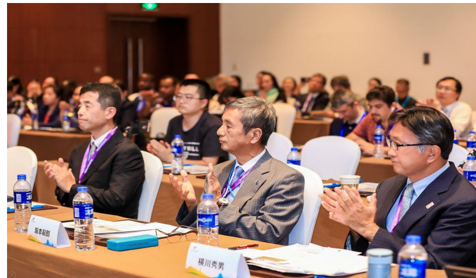
会 場 風 景