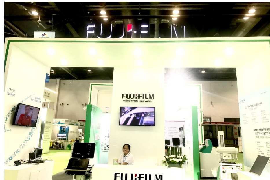
富士フィルムブース