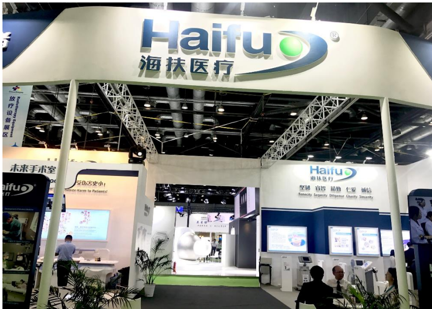
重慶ハイフメディカルブース