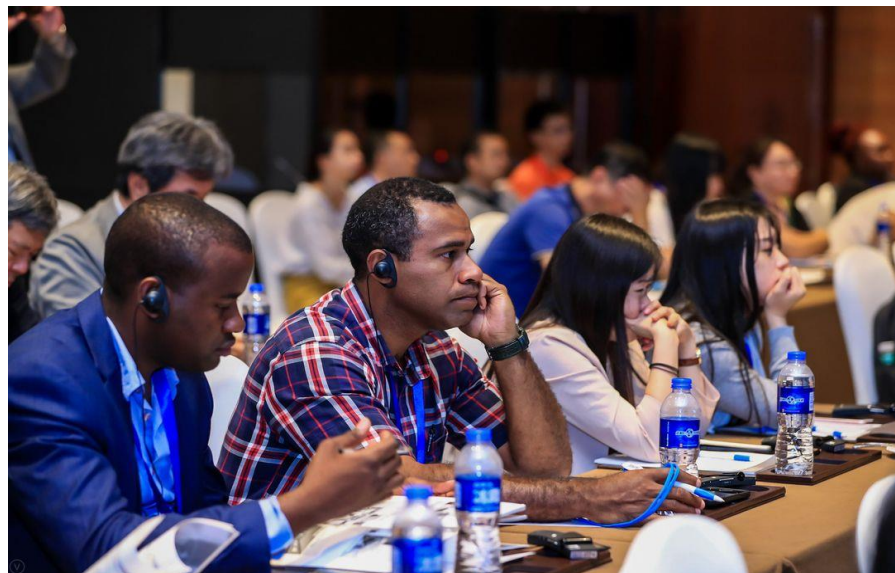
会 場 風 景