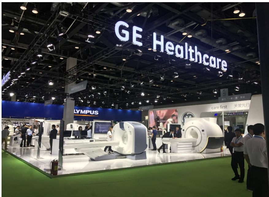
GEヘルスケアブース