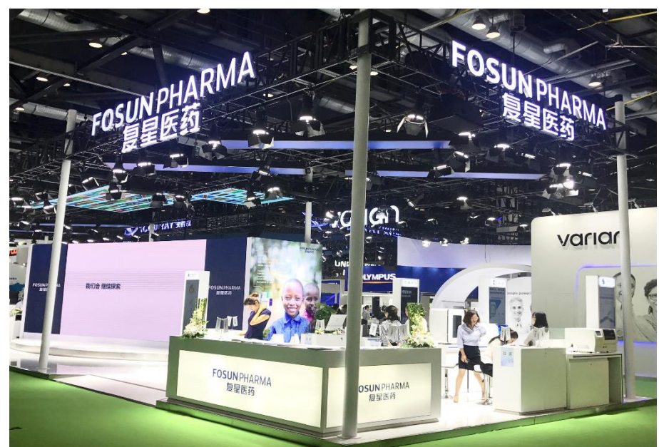
上海复星医药ブース